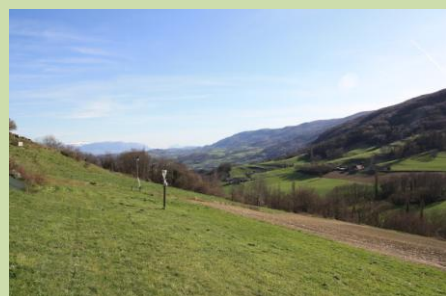
le 5, première tonte de la pelouse