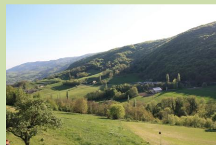
le 28, ensoleillé et presque chaud