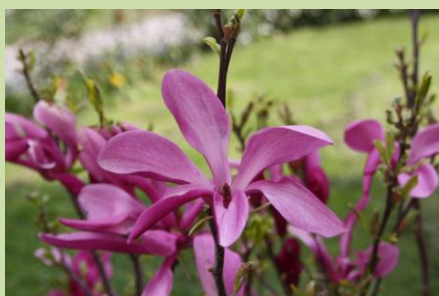
le 18, les arbres sont en fleur, ici le magnolia